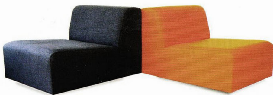
Der «Lounge Cube» liegt mit seiner skulpturalen, reduzierten Formensprache im Trend. Es gibt ihn nur als Sessel, lässt sich aber zur einer Gruppe zusammenschieben.