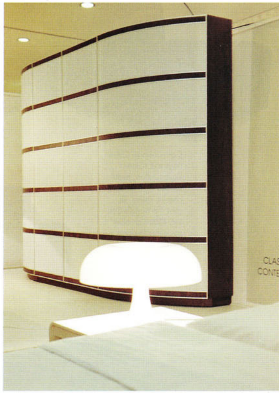
«Laszlo» ist ein modulares Schranksystem, geprägt durch horizontale Aluminiumprofile. Die Oberflächen sind wählbar.

bundenheit zieht sich wie ein roter Faden durch sein Leben, ist in den Möbeln noch spürbar – bleibt man nicht an der Oberfläche haften.